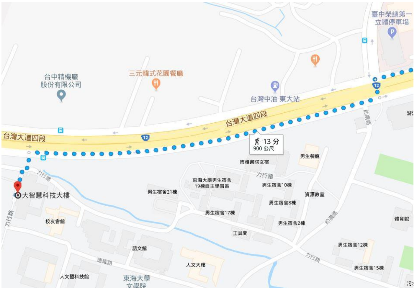
圖四 校門口步行至會場示意圖_2 (進校門後→力行路右轉向上, 沿途經過男生宿舍, 語文館, 工設系館, 建築系館, 到達活動會場)